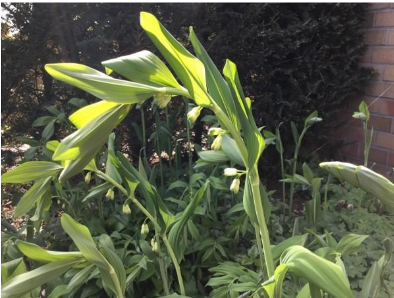
SALOMONSZEGEL spec ( aangekocht ), vermoedelijk gewone salomonszegel, maar kan ook welriekende salomonszegel zijn volgens OBSIDENTIFY. Naamgeving zie onderaan.