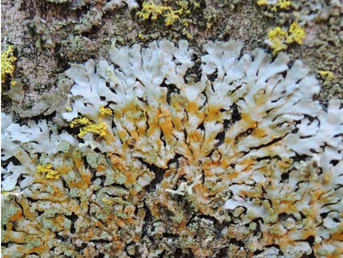
kleurig rond schaduwmos