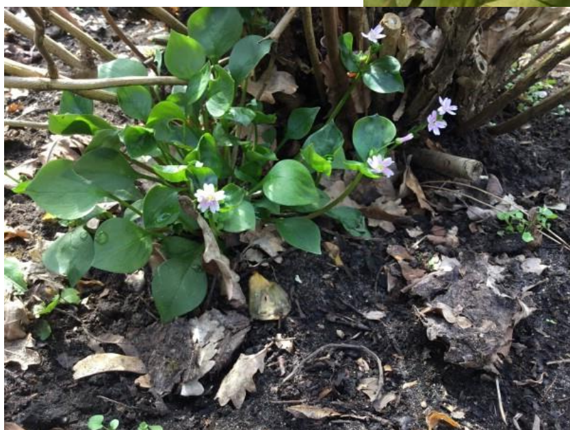
ROZE WINTERPOSTELEIN ( dwaalgaast ), ... voelt zich thuis happy, overwoekert graag