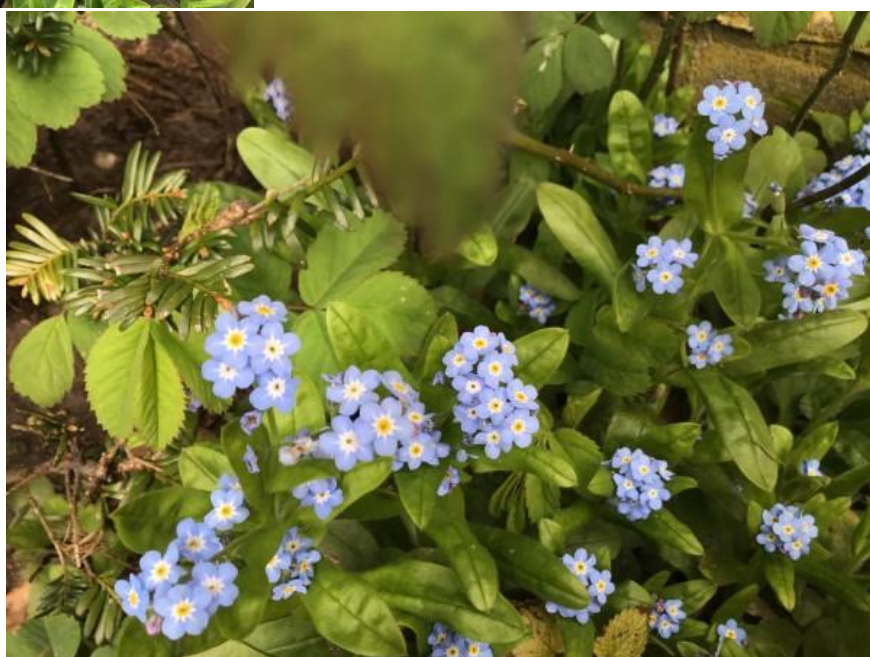
BOS-VERGEET-ME-NIETJE ( dwaalgast ) Naamgeving zie onderaan