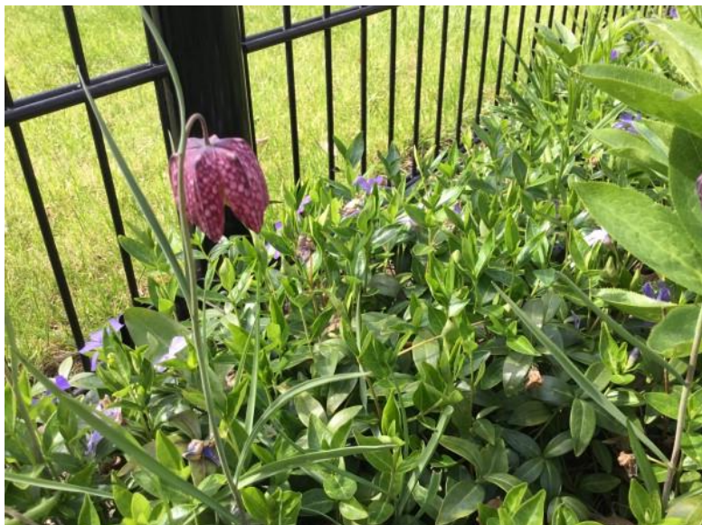
KIEVITSBLOEM ( ooit geplant )