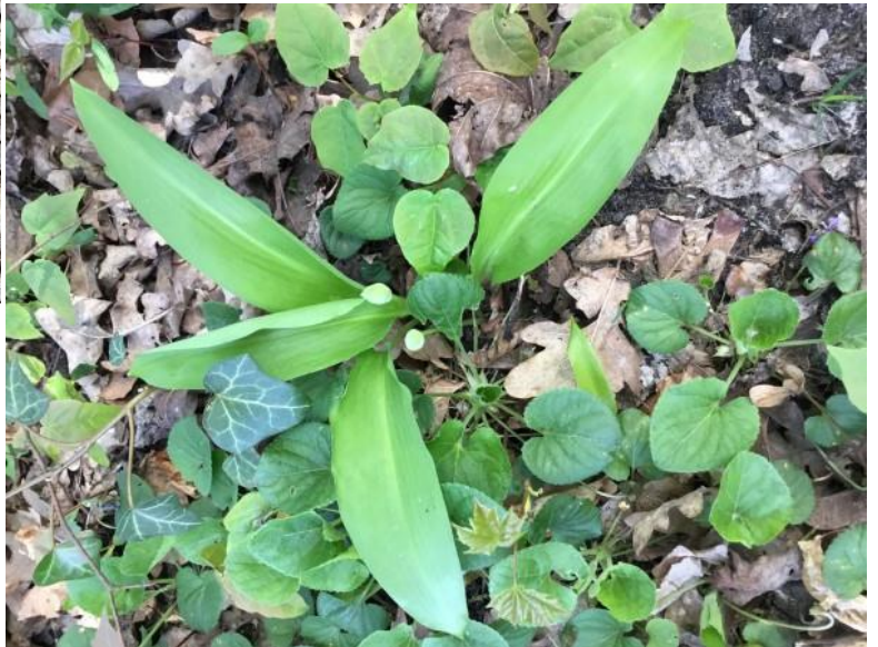
DASLOOK ( dwaalgast ); kalkminnend?