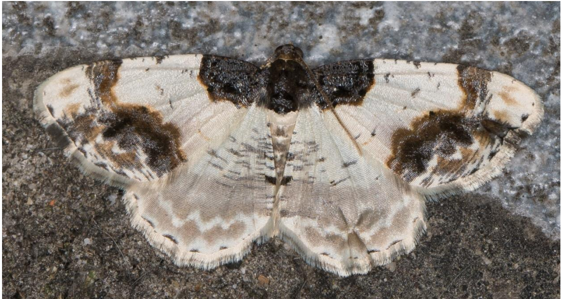
Foto van de aangebrande spanner hier en de rest is te zien in de link hieronder:

https://waarnemingen.be/users/94286/photos/?after_date=2020-04-09&before_date=2020-04-09&species=&species_group=8&province=&rarity=&search=&location=&sex=&validation_status=&life_s