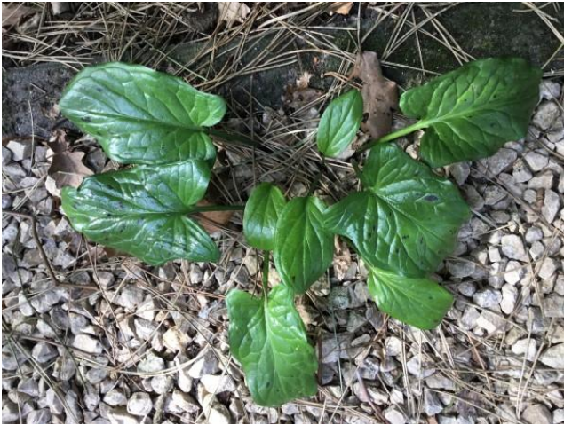
GEVLEKTE ARONSKELK ( dwaalgast ), kalkminnend?

Verder heb ik me even verdiept in naamgeving van twee voorkomende planten in mijn georganiseerde wildernis. DD